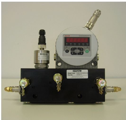
Slika 7. FMM blok sa multisenzorom HYDACLab i automatskim mjeračem čestica CS1000

Pod pojmom kondicioniranja ulja mislimo na kombinaciju postupaka, koja će osigurati željeno stanje fizikalno- hemijskih osobina ulja. Prije svega, radi se o filtriranju ulja sa kojim izdvojimo čvrste čestice i "sušenju" ulja sa kojim izdvojimo vodu iz ulja.