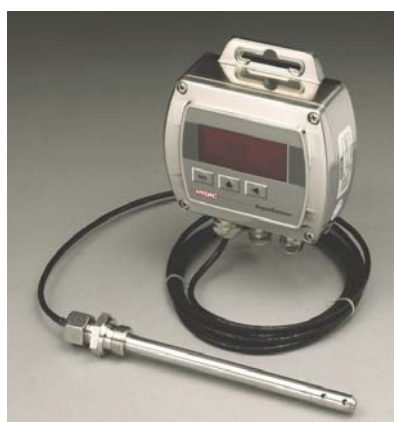
Slika 5. AquaSensor 2000