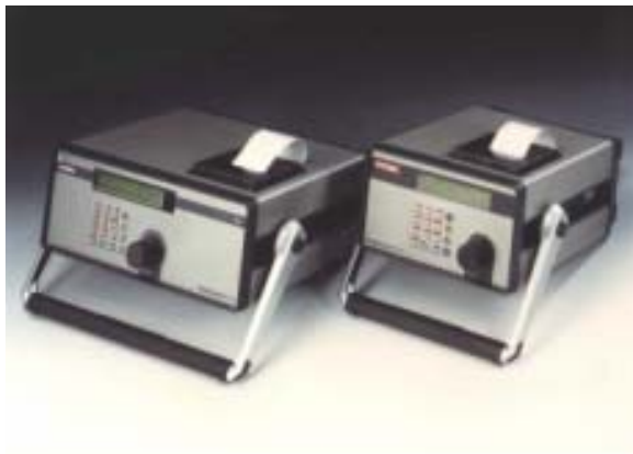
Slika 2. Automatski prenosni brojač čestica

Za primjenu u praksi se uobičajeno koriste automatski brojači čestica (slika 2, slika 3), prenosni ili fiksno ugrađeni, koji funkcioniraju na principu prigušivanja svjetlosti.