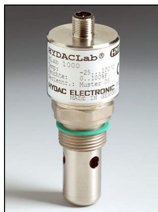
Slika 6. Multi senzor HYDACLab