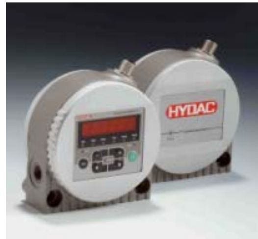
Slika 3. Automatski brojač čestica za fiksnu ugradnju