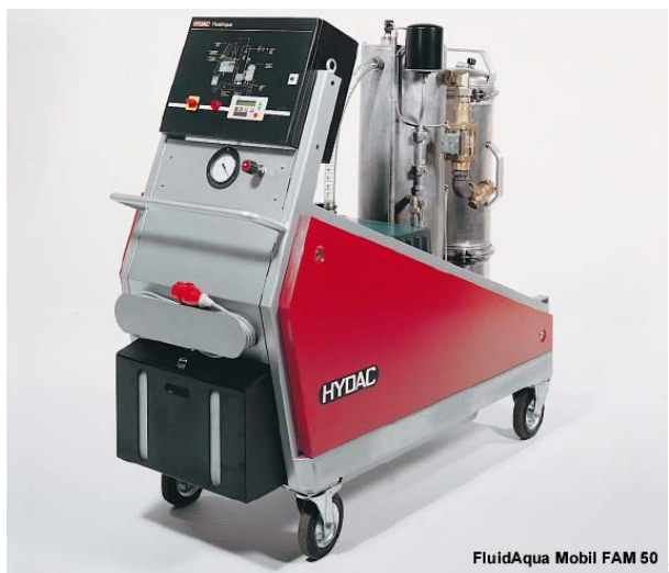
Slika 8. Agregat za kondicioniranje ulja FluidAqua Mobil 50

Primjer servisne oprema za kondicioniranje ulja je prikazan na slici 8. To je agregat, namjenjen za upotrebu u by-passu, koji istovremeno filtrira ulje i izdvaja vodu i gasove iz ulja. Opremljen je sa mjerno-kontrolnim uređajima, koji prate stanje ulja u sistemu, te ga po potrebi samodejno aktiviraju.